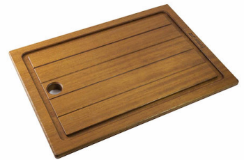
Tabla de corte de madera Iroko 8643 117