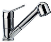
Monomando S1000 - Z65 8449 500